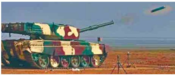
नगर : के. के. रेंज येथे लष्करी संशोधन व विकास संघटनेतर्फे लेसर गायडेड रणगाडाभेदी क्षेपणास्त्राची चाचणी बुधवारी घेण्यात आली.

पुणे, ता. २३ : युद्धभूमीवर शत्रूच्या रणगाडांचा नेस्तनाबूत करणाऱ्या लेझर निर्देशित रणगाडाभेदी क्षेपणास्त्राची (एटीजीएम) यशस्वी चाचणी लष्कराने आज घेतली. नगर येथील केके रेंजमध्ये अर्जुन रणगाडाचातून क्षेपणास्त्र डागून ही चाचणी घेण्यात आली आहे.