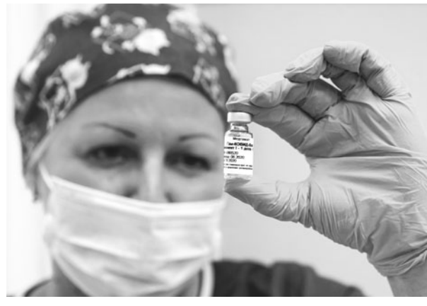
A nurse shows Sputnik-V vaccine in Moscow last week

Some world powers might be wagging their finger at Russia's apparently transactional support to Alexander Lukashenko, the authoritarian president of Belarus. But India has averted its eyes from these developments, as it had done previously in the case of Ukraine and Crim-