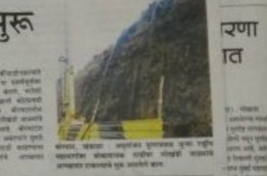
दराडी काढण्याबरोबर लोखंडी जाळ्यांचे काम सुरु झाले आहे.

दराडी काढण्याबरोबर लोखंडी जाळ्यांचे काम सुरु मुंबई - मुंबईतील दराडी काढण्याबरोबर लोखंडी जाळ्यांचे काम सुरु झाले आहे. दराडी काढण्याबरोबर लोखंडी जाळ्यांचे काम सुरु झाले आहे. दराडी काढण्याबरोबर लोखंडी जाळ्यांचे काम सुरु झाले आहे.